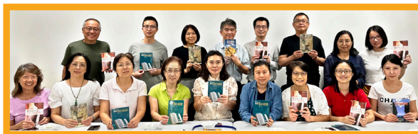
德州费斯可基督徒教会团契小组使用渔夫查经系列