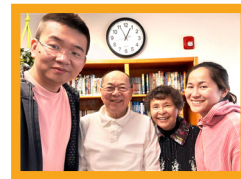
与来自荷兰年轻的冯斯崎和Michelle传道欢聚

道。感谢神让我们有机会与交友数十年的主内好友和年轻后进见面，大家都在忠心地服事主，真是神的恩典！