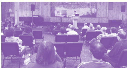
大家專心聆聽信息