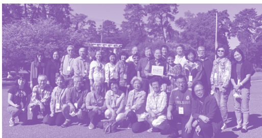
更新董事與同工大合照

神在不同的地方使用祂的兒女，又藉著更新把不同地區的教會領袖連接在一起，這讓我們分外感恩。我們同時也感謝神，因著疫情，反而讓大家能不被地區所限地同心服事主；以前是風聞他們的事工，現在藉著Zoom都能親眼見到人！遠程的同工們一分享完，大家就迫不及待地走向銀幕的鏡頭前跟他們打招呼問好。