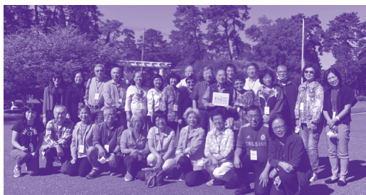
更新董事与同工大合照

神在不同的地方使用祂的儿女，又藉著更新把不同地区的教会领袖连接在一起，这让我们分外感恩。我们同时也感谢神，因著疫情，反而让大家能不被地区所限制地同心服事主；以前是风闻他们的事工，现在藉著Zoom都能亲眼见到人！远程的同工们一分享完，大家就迫不及待地走向银幕的镜头前跟他们打招呼问好。