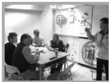
與農使團開會之二