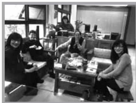
北美台灣更新同工相見歡