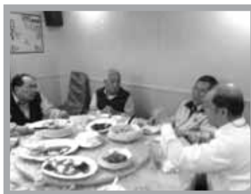
會後聚餐其樂也融融