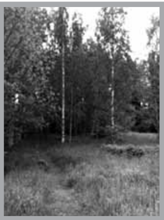
赫爾辛基四處草木扶疏