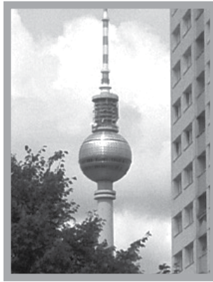
只要有太陽就可見到十字架的柏林電視台