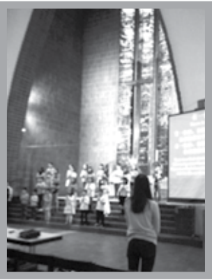
柏林華人基督教會兒童詩班