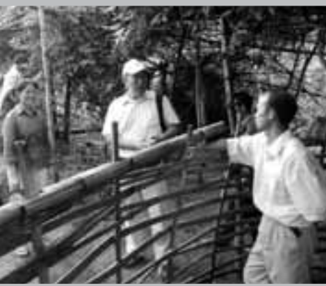
農業使命團教導村民改良養豬方式