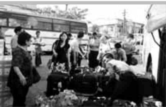
前來支援臘戍事工的短宣隊

2010-2013年，神更進一步幫助我們積極提供山區村民，特別是苗族，改善他們的生活。神給我們智慧想到該如何從事這項事工。我當時是受到2006年諾貝爾和平獎得主，孟加拉的經濟學家猶奴斯所說的一句話的影響：「誰說窮人不還錢？」結果證明他是對的！我們的方式是在當地遇到好機會時就購買土地，將所購之地劃成井字，中央部分規