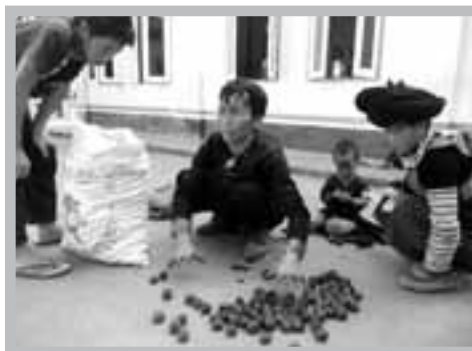
誰說瞎子不能養家？學會種胡桃，一樣可賣好價錢。