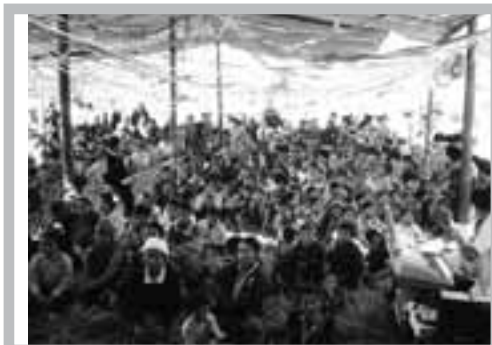
甘蒙山苗族教會同慶聖誕