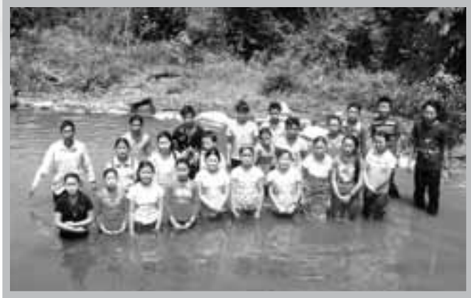
貴概地區初熟的果子

除了戶理中心外，神又賜下資源，使我們在2000-2001年間，在同一地點，建蓋了第二棟建築物，作為戶理錫安堂的聚會地點，可容納300人聚會。而原來用作為辦公室及福音中心的第一棟建築，則改建為更新戶理孤兒院，目前收