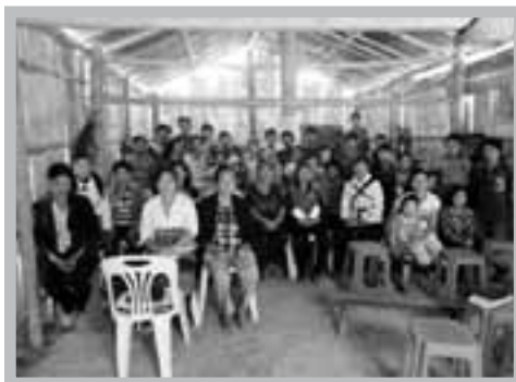
教會建築簡陋難想像，聖靈作工不減半。

由1998在戶理開始山區事工起，到2013年為止：我們已在以下7個地區建立起24個不同族群的教會、9間中小學校及