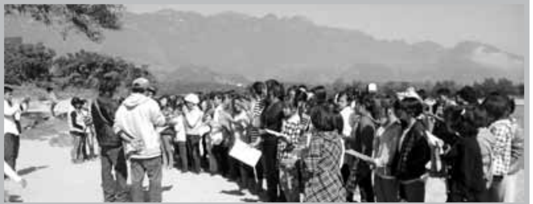
滾弄江邊各民族青年聯合聚會