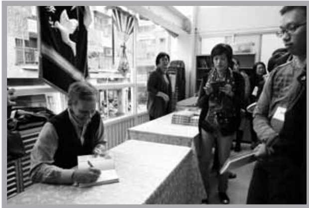
柴培爾為購買〈真愛方程式〉者簽名

在柴培爾牧師服事的教會，牧師團面試新牧師候選人時常會問一個問題，「你的妻子順服你嗎？」但牧師團中一位牧者所謂「順服的師母」，其實是指「受壓抑的師母」。這位牧者的妻子，除了丈夫不在家不得擅自出門，連發表言論、穿著都受到絕對的控制。於是師母愈顯憂鬱，而該牧師日後得了嚴重的憂鬱症，也因得不到妻子恩賜中的幫助，情況愈來愈糟。