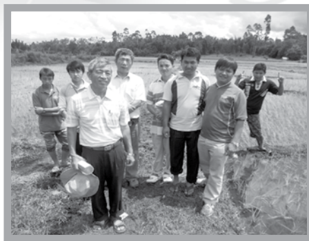
台灣農業使命團以短宣方式成為我們的顧問

我們懇請有能力的主內肢體協助我們一同完成「你們給他們吃吧！」這個心願。請在禱告中記念我們，惟願神的心意成全。