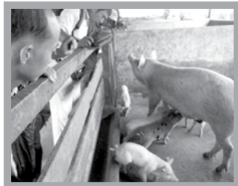
進行中的養豬計劃

給我們，售價經討價還價後敲定為緬幣六千一百萬元（約美金八萬元）。農地有三所建築物可就地使用。我們計劃將養雞場遷過來，並開闢養豬場及種植蔬菜，三種用途的農場，這樣也可避免開闢單一農場的危險。