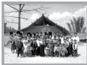
簡陋的聚會點及苗族工人訓練中心 右前方第一排右第3人為更新緬北工場主任，央正義牧師