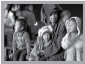
緬北山區的少數民族

耶穌用五餅二魚餵飽五千男人的故事在四本福音書中都有記載，可見使徒們何等看重這事件的信息——「你們給他們吃吧」！然而一開始時並不是這樣的，起初當門徒遇見有這麼龐大的聽眾等著吃時，他們很自然想到的解決方法就是「叫眾人散開……自己買甚麼吃。」（可6: 36-37），而耶穌的答案卻是「你們給他們吃吧！」。為何耶穌與祂的門徒對眾人之需要的看法會有這麼大的差異呢？關鍵就在於是否有一顆「憐憫人的心」（可6: 34）。耶穌要藉著這個故事讓門徒了解祂的心，並且也要後來跟隨祂的人能持同樣的心態來對待世人的苦境。每個世代的基督徒都會面對自己社會中龐大的需要，耶穌不要我們給的答案是「對不起，愛莫能助！」祂的心意是「你們給他們吃吧！」耶穌這顆憐憫的心也就是信徒從事宣教的起點。宣教乃是起於主耶穌憐憫的心，再透過門徒憐憫的心而採取的福音行動。