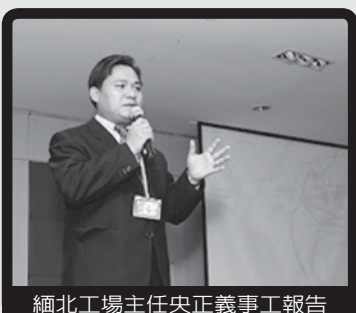
緬北工場主任央正義事工報告