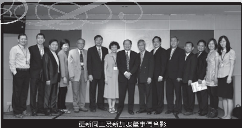
更新同工及新加坡董事們合影

新加坡更新傳道會能夠走過二十個年頭，當然是經歷了使無變有的神，但同時也是許多主內肢體的愛心付出成就了這個奇蹟。更難得的是許多的奉獻都是「窮人的奉獻」。所以，當我深深感