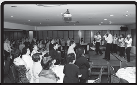
大家同心感恩歡唱