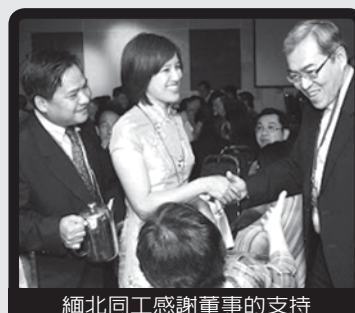
緬北同工感謝董事的支持