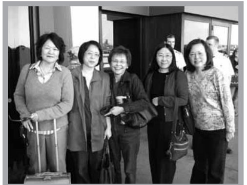
出征密西根的小組長們機場合影