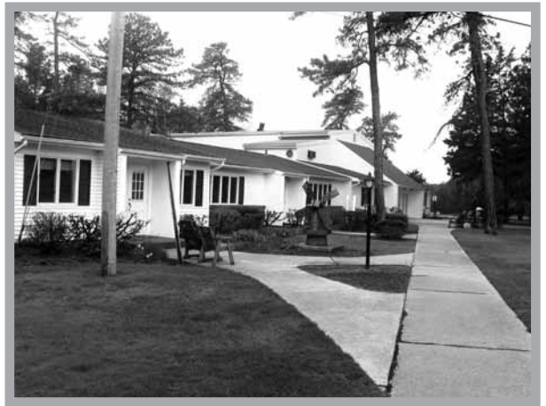
環境優美的新澤西營地

題的方式來帶人查考經文，而組員則按問題找出答案。當然事先的預備很重要，但真正上陣時發言的卻