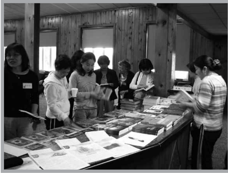
更新書攤—讀經要有好書來相配

的時間內義不容辭的上陣幫忙，對她的幫助及熱愛聖經的態度，我們實在佩服，也心存感謝。