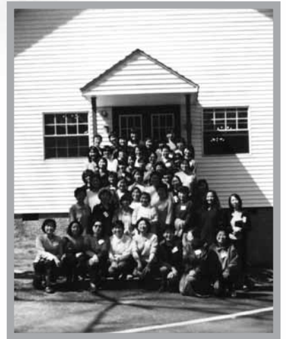
2003新澤西第一屆姊妹讀經