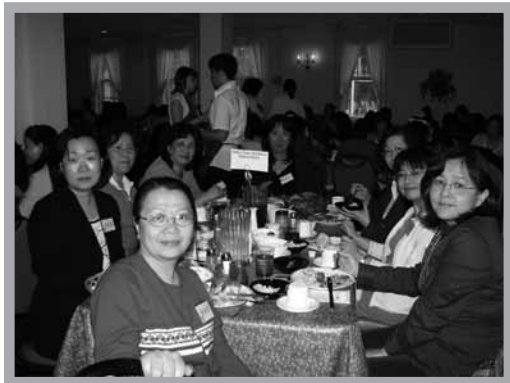
營會期間美食不斷，且有人服事

更有甚者，大家對這種不必打扮就可「赴會」的禱告方式興趣有增無減，即使營會結束後好幾個月，還有小組長與組員繼續以這種方式集體聯絡，粵語小組相約要在八月間，在一位組員家中團聚BBQ。至於