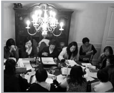
小組長事前預查工夫沒少下