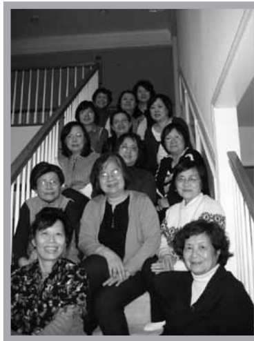
新澤西州小組長2010年合影

姑且不論這些目標至今有沒有達成，姊妹讀經營走過八年的歷史，我們倒是看到好些意想不到的好處，令我們心生感謝：