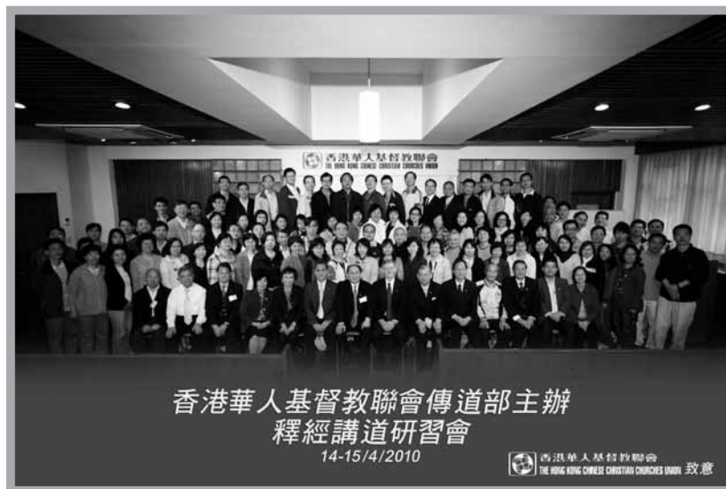
香港華人基督教聯會傳道部主辦 釋經講道研習會 14-15/4/2010

感謝神，我們當時的初衷是希望藉著釋經講道研習會，讓各地華人教會的講台能看重以基督為中心的講道，卻沒有想到，許多言語不同的神的兒女早已聯合為一體，即使言語生澀，文化不同，溝通不良，但在基督裏早已成了一家人，那道語言的牆也早被基督的寶血拆毀了。難怪無論在離開台灣或離開香港時，才認得兩天的朋友也都會緊緊相擁，互道珍重，互說我們明年再見！（長真文）