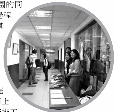
台北會場一樓報到處

此外，令我們訝異的是與會者，不但人數超過我們的想像，使我們在研習會前一個月就需因場地容納不下而早早截止報名，而且更美的是，學員所代表的宗派眾多，由最保守安靜的教會到靈恩運動影響活潑的教會，由開始學習講道缺乏經驗的神學生到講道多年，到已經在教導他人講道的傳道人。望著擠得滿滿的華神禮堂，看大家聚精會神地上課，振筆疾書寫講義筆記的情形，我不禁熱淚滿眶，心中默默向神禱告：「主啊，願所有的與會者此後高舉聖經，站在自己的講台上以傳講你的話為榮，讓你大能的言語遍滿台灣全地，一句也不徒然返回！求你復興台灣的教會！」