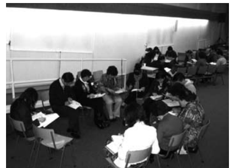
聽完李牧師的大堂分享登山寶訓，查起經來不亦樂