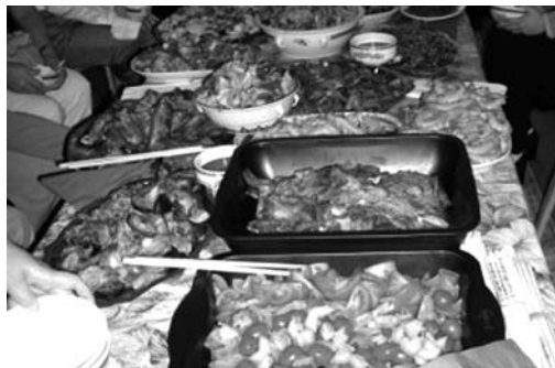
查經有時，吃飯與玩樂也有時。