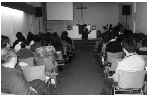
組員分享查經心得。

此次參與更新的荷蘭短宣之行，使我嚐到許多的「第一次」經驗：如第一次上講台講道；第一次吃荷蘭出名的生魚；第一次有師母帶我們去看她當年與她的牧師丈夫相戀的中學，及定情的教堂；第一次看到小人國的精心設計等等。但我最感謝的是，天父的恩典與慈愛遍及全地，這才使我們原來並無關係的中國人能親如一家人，一同在神的話語上熱心追求長進，並一同期待主的再來。希望這不是我最後一次的荷蘭之行，我切望好好裝備自己，來日還有機會重返荷蘭，與當地的弟兄姊妹在神的話語與門徒訓練上，一同切磋，一同追求。