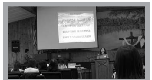
敬拜讚美中琴韻歌聲