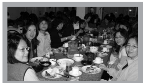
大快朵頤兮飯來張口