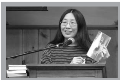
更新編輯不但能編能改，也能賣書