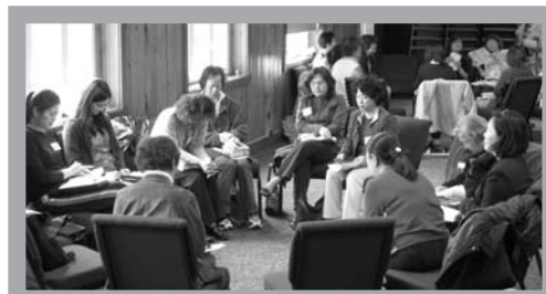
分組查經其樂融融