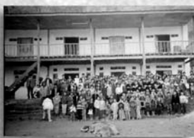
緬北更新戶理福音中心落成，果敢人、苗人及克欽人信徒一同參加感恩禮拜。