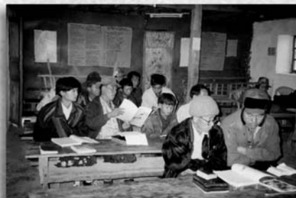
緬北果敢信徒學習背聖經及使用豐盛生命教材。