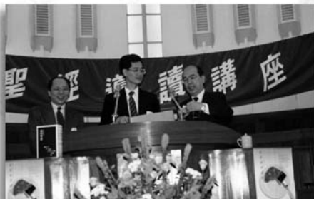
早自九〇年代，更新就開始讀經講座的訓練，該會中研讀本聖經編輯鮑會園主持頒獎典禮。