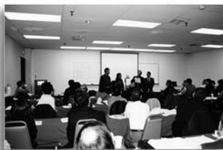
▲第一屆更新學院學員領取證書

姊妹讀經營始自2003年，每年在四月底舉行，已進行四次。每次都有專門研讀的聖經書卷：2003年約翰福音；2004年基督徒的氣質：登山寶訓；2005年詩篇選讀；2006年聽道與行道。若神許可，我們也盼望日後能舉辦弟兄讀經營。