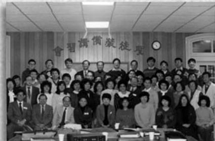
第一屆北美聖徒裝備講習班就在美國總會旁的一間美國教會舉行，學員來自各地，也從此展開在各地的門徒事工。