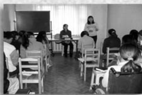
主日蒙古文崇拜，一同禱告讚美神。