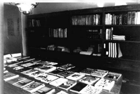
出版各類屬靈書籍是我們的主力。

自1971年至今已出版近一百五十本屬靈書籍（包括福音預工及各類門訓、查經等教材）。更新月刊每年十期，發行全球超過兩萬五千份。並出版兩本有份量助讀本聖經——研讀本及尋道本。且自1997年至今共送入中國大陸近六萬本的宣道版研讀本聖經。