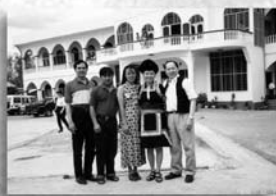
更新總會、新加坡分會及緬北工場主任在臘戌相見歡。

外蒙古事工始於2001年夏，藉著語言中心更新同工設法與蒙古人接觸，開始福音工作，如今已在首都烏蘭巴托成立一「外蒙古更新教會」，目前有二十多人。今年夏天（2006）我們亦開始發行蒙古文的「福音橋」，有一些美國短宣隊及醫療隊前往蒙古短宣時均來信訂購。我們也在計畫出版蒙古文的「豐盛生命」教材，請代禱。