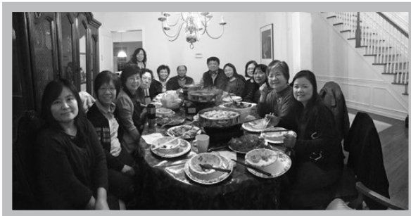
靈糧、肉糧一樣也不缺

的事工，包括探訪過去幫助過的拉胡族與客倫族傳道人，並處理一些突發的人事問題等。待短宣接待中心完工後，盼能有新的宣教士、新的同工前來幫助泰國的福音工作，希望大家在禱告中記念這事。