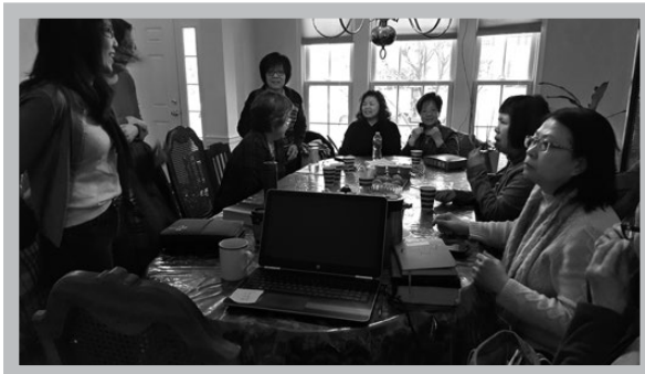
預查要開始了，各就各位！

會主日傳講信息；6/11-9/10則在北維州Charlottesville夏市華人基督教會從事門徒訓練。願神賜福他的腳蹤，給他健康的身體、活潑的靈力。也請為他所服事的教會禱告，願人人受過門徒訓練之後，都能成為帶領別人作門徒的人。