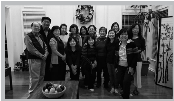
舊雨新知相聚樂無窮