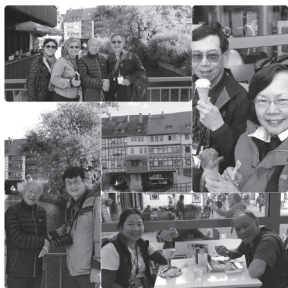
與路德相比我們日子可不賴喔！

1530年路德、墨蘭頓等人在選侯堅定的約翰鼓勵下，來到托爾高，為新教信仰簽署了《托爾高信條》，這是《奧格斯堡信條》的前身，因此此