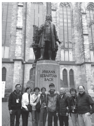
能與巴哈留影非易事！

德故事》的文豪哥德。萊比錫另一個有趣的教會就是聖尼格拉斯教會。當時東西德尚未統一，兩邊百姓的生活水平差距很大，生活的自由度更是天壤之別。有兩位年輕人在聖尼格拉斯教會開始每週一的查經禱告會，未料到了1989年的9月，參加週一禱告會的人數愈來愈多，大家都同心為東德禱告。萊比錫與當時的東柏林不同，此地每年舉行國際商展，西德及外國商人進出還算自由，同時也不像東柏林常有秘密警察監控，因此這類和平的聚集與禱告會政府並沒有禁止，再加上西德媒體的報導，禱告會的消息傳遍東德各地，許多小鎮也開始舉行類似的週一禱告會。沒想到只有兩個月的時間，原來在聖尼格拉斯教會庭院的禱告會由幾百人，一下漲到7萬人，又過一週禱告人數漲至12萬人，再過一週則漲至32萬人，都擠在教堂外的廣場上。當地的東德政府為了避免大