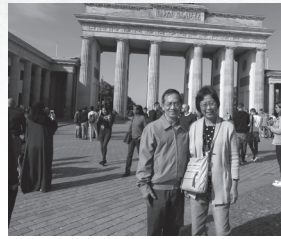
布蘭登門前的陸蘇河夫婦

路德當年受洗的教堂已重建，他嬰孩時用的受洗盆被挪至另一個小房間，如今教堂內部明亮且現代化。路德宗是接受嬰兒洗的，此教堂之所以特別是因為在講台前方有一個圓洞，洞中活水暢流，洞旁有一圈又一圈向外擴張的圓圈花紋設計，代表路德期望日後向全世界擴張的教會，要強調受洗歸入基督的重要。這是路德一生的心願，可惜今天許