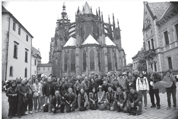
布拉格的宮廷教堂

中午我們在聞名的查理大橋旁一家名餐廳進餐，吃什麼不太記得了，倒是第一次嚐到德國與捷克特有的生碎牛肉。第一次與此特餐相識，也弄不清它是何許人也，但我和外子是對擺在面前的食物，都一律下肚的人。當同桌的人要求換成生菜沙拉時，我們還以為是生魚，吃得津津有味！餘