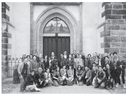
在95條論綱坊前合影

威登堡的城堡教堂不但大門有名，也是當年路德經常講道的地方，為紀念他，墳墓就安置在講台下方，成了遊客必到之地。離教堂不遠處的大街上是他教書的威登堡大學，這所大學已不存在，只留下牆上的說明。再往前行街尾處就是路德任教時住宿的奧古斯丁修會宿舍，日後選候買下作為路德的私人住宅，路德好客，因此他的家一如客棧。離此不遠的