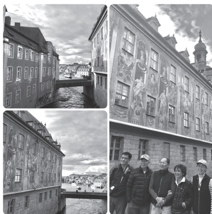
跨河而建的班堡市政廳

匆匆參觀過科堡的路德教堂與博物館，我們就往捷克出發。中午抵達一座美麗的捷克小鎮——卡羅維瓦利，此城與路德無關，卻是前往布拉格必經的溫泉度假勝地。全城沿河而建，不遠山坡上一棟棟顏色艷麗的建築，據說曾是當年俄國高官的別墅，此城自古就是許多歐洲人度假洗溫泉浴的勝地。我們去的一座溫泉迴廊共有12座溫泉，據說喝這些溫泉水